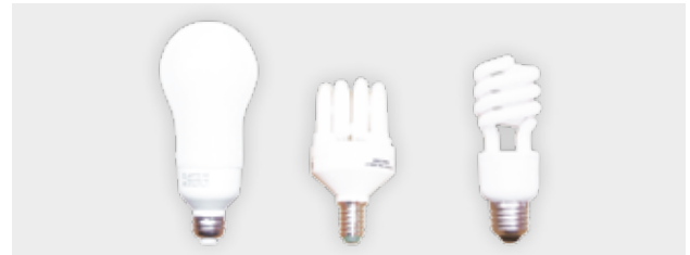
Les LFC sont disponibles partout et une gamme étendue existe.

Pour ceux équipés d'un variateur, la compatibilité de la lampe est indiquée sur son emballage ; • leur prix a beaucoup diminué ; • certaines LFC sont équipées de systèmes à baïonnette : il n'est pas nécessaire de remplacer toutes les douilles de ce type.